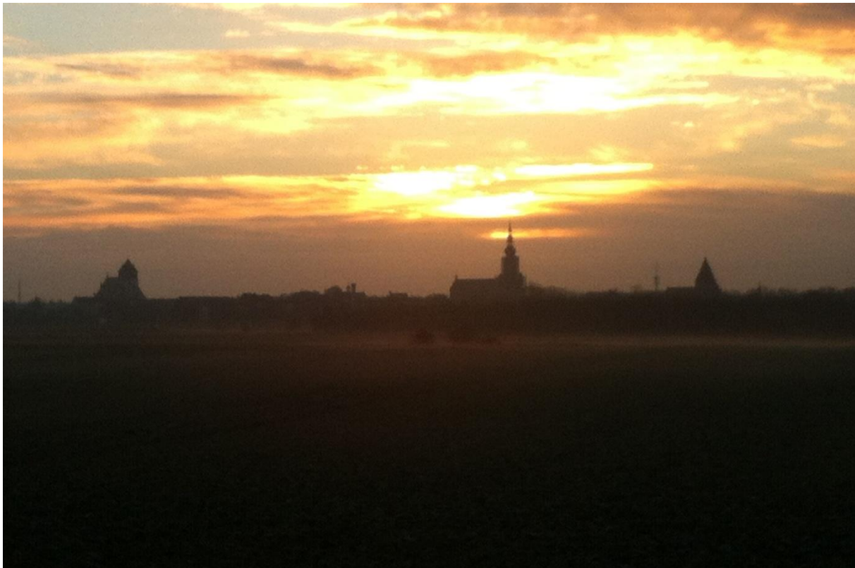
Abb: Sonnenaufgang über Greifswald