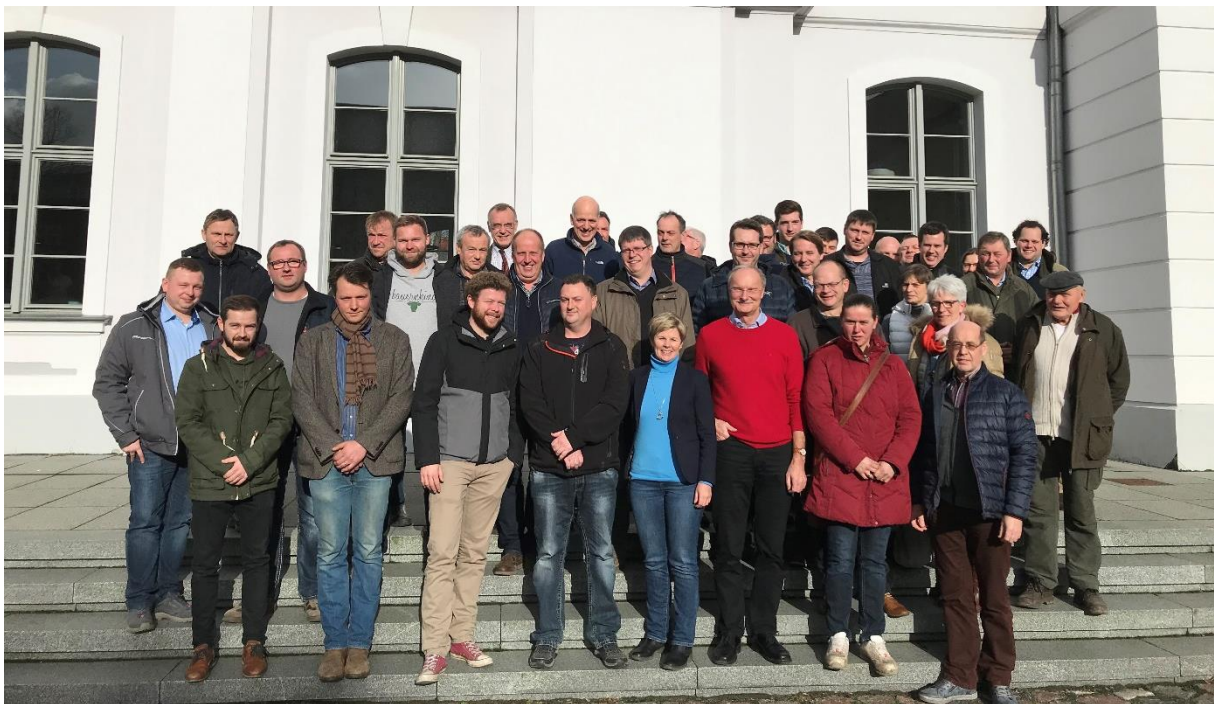
Die Gründungsmitglieder des Vereins Greifswalder Agrarinitiative